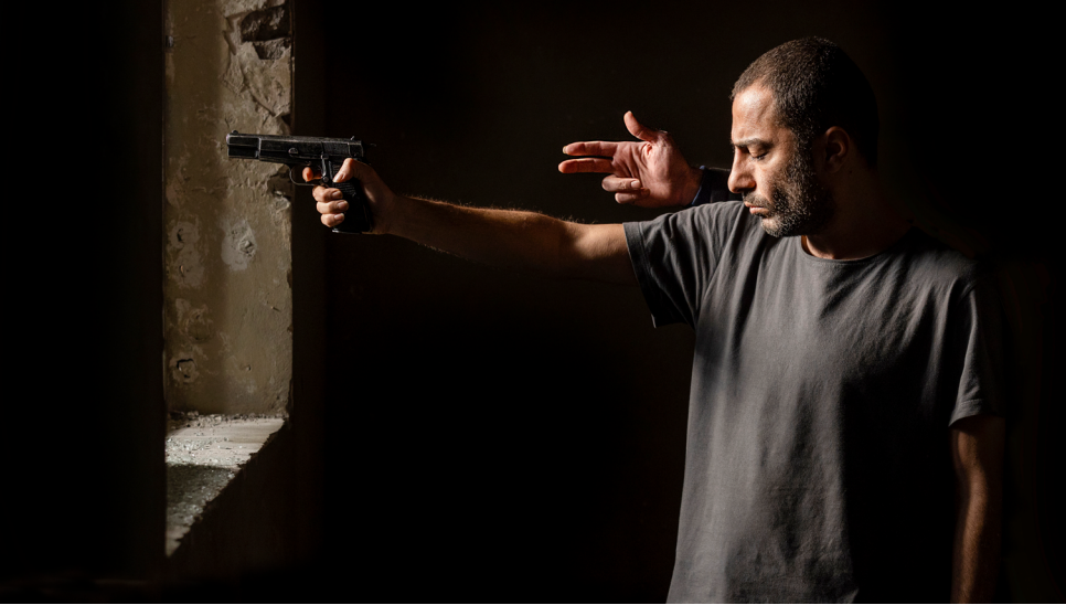
Beyond the Wall de Vahid Jalilvand