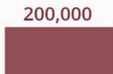
Number of people missing