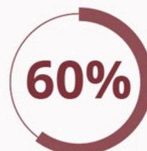
Share of Syria controlled by the regime in March 2021

Instances where chemical weapons have been used